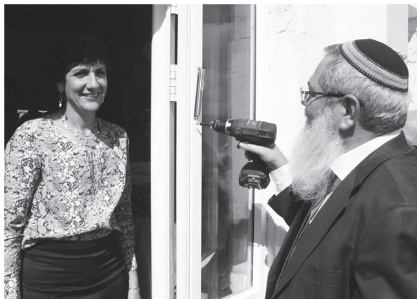
טג השר הרב אלי בן דהן קובע מזווה בשדמה ולידו ח"כ שולי מועלם-רפאלי, ר"ח חשון תשע"ד, 4/10/2013.

בנאומו בטקס קבע סגן שר הדתות, חבר הכנסת הרב אלי בן דהן כי "לא תהיה ריבונות אחרת בארץ ישראל אלא רק למדינת ישראל". ברוח משנתו החינוכית של הרב צבי יהודה קוק הדגיש כי יש לשוב ולחזור על עובדה וקביעה זו: "נחזור על האמירה הזו עוד ועוד ללא הרף. רק החזרה הזו תיטע את הדברים בתוכנו. עוד יהיו כאן משפחות וילדים ומכאן תתרחב הריבונות על כל יהודה ושומרון ונמשיך להיאחז בכל מקום ומקום".