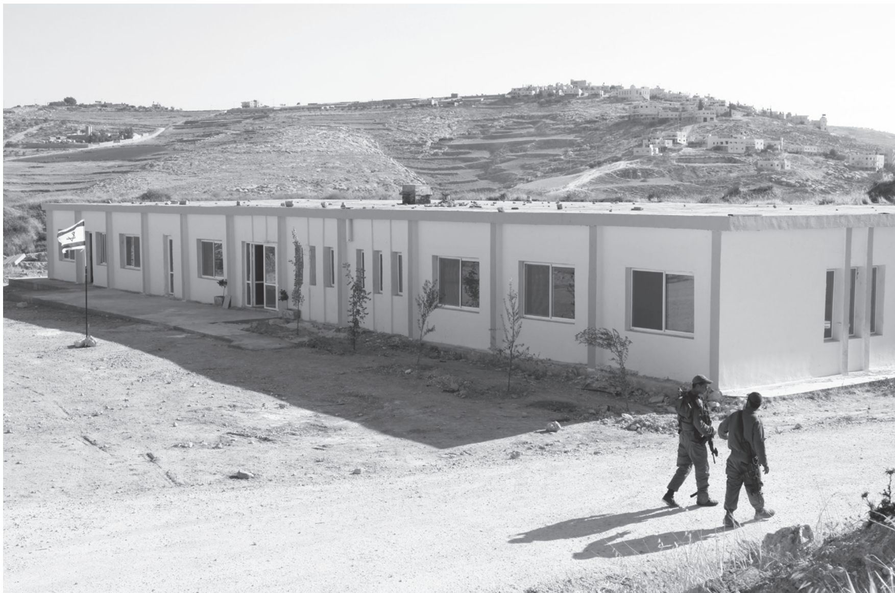
שדמה לאחר השיפוץ הקל.