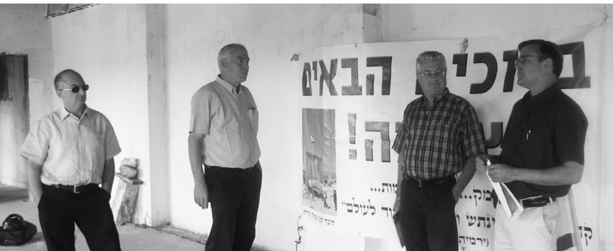
השר אורי אריאל בשדמה, 2009 עם ראש מועצת גוש עציון לשעבר שאול גולדשטיין, ח"כ לשעבר פרופ' אריה אלדד, וד"ר חן ביימן.

אריאל מודע היטב לכך שההלך כזה לא יתרחש בן רגע ובכל זאת הוא מוצא חשיבות בהצבת החזון כיעד: "זה החזון. זה לא יקרה מחר ולא