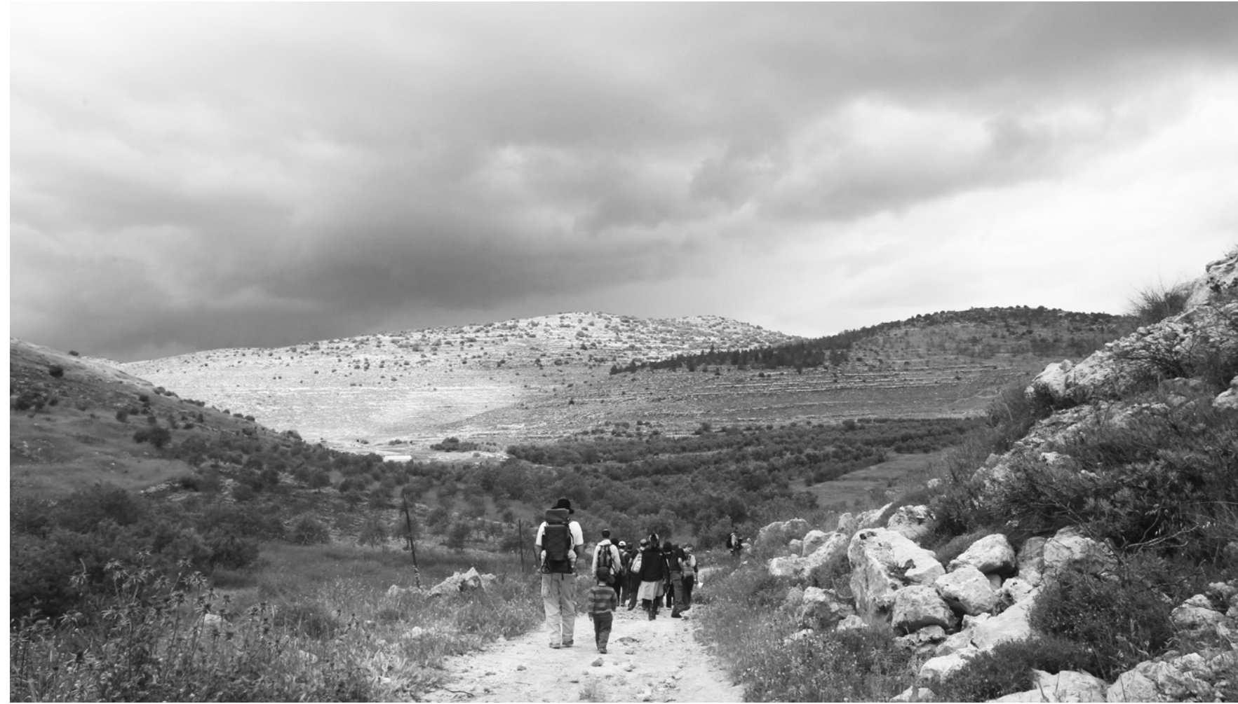
עליה לחומש